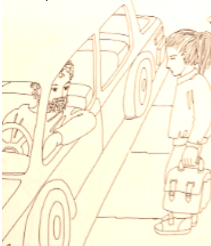
Mon petit monde, Guérin, Denise Dutil, p.32)