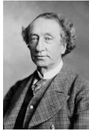
Sir John A. Macdonald

Sir John A. Macdonald, le 1 er premier ministre du Canada, avait comme vision d'unifier les provinces entre-elles en créant un seul pays. Pour ce faire, il a dû convaincre les représentants des colonies des maritimes, soit le Nouveau-Brunswick, la Nouvelle-Écosse et l'Île du Prince Édouard, d'entrer dans la Confédération lors d'une rencontre qui a eu lieu à Charlottetown en 1864. Il les a convaincus en leur disant que des colonies séparées sont faibles, devant la menace d'invasion des terres par les États-Unis, mais si elles s'unissent, elles pourront faire de grandes choses.