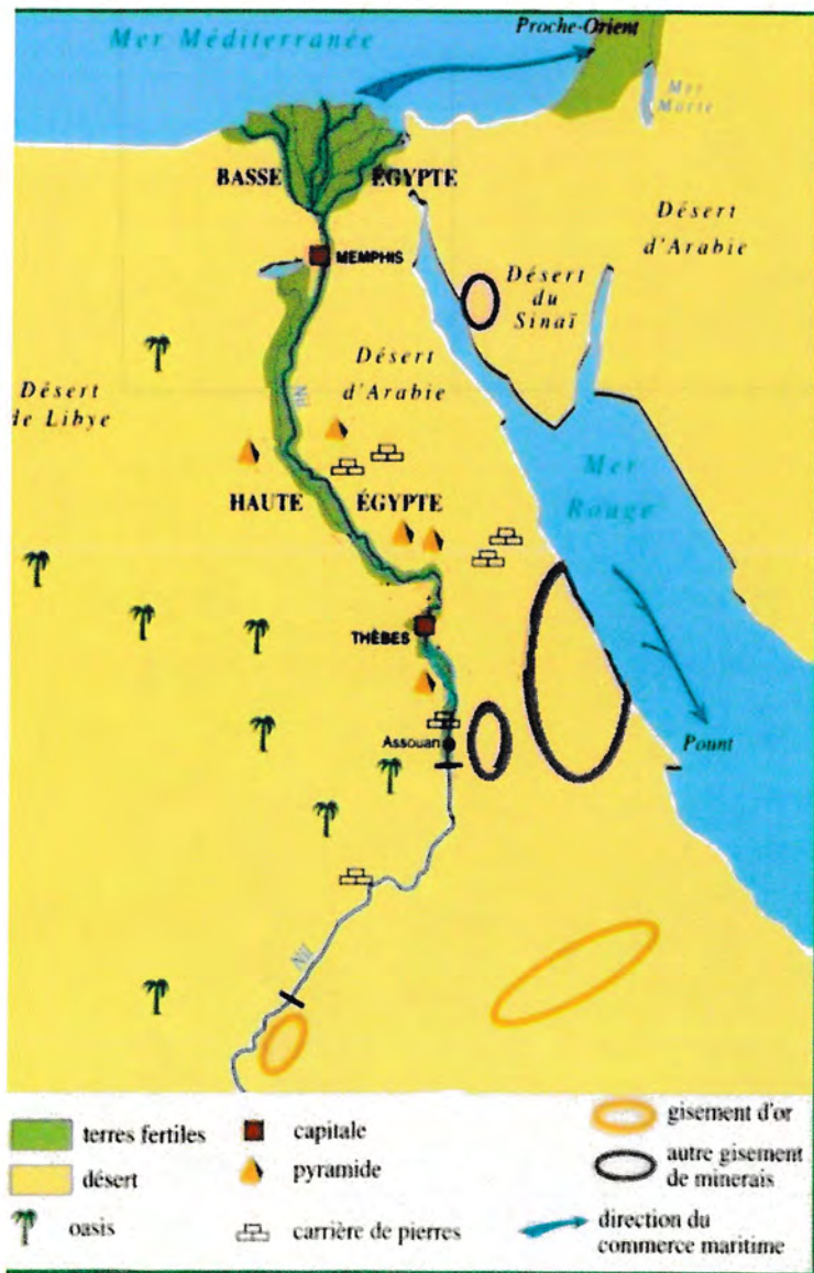
Égypte antique - Période plus ancienne