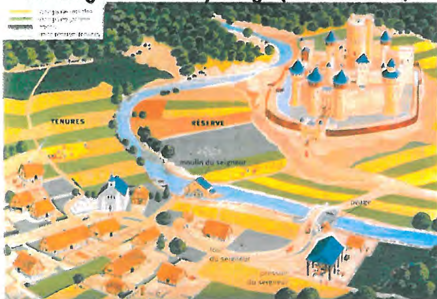
Une seigneurie au Moyen Âge (reconstitution)